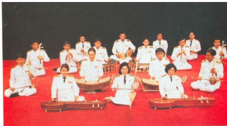
ภาพที่ 6.19 วงมโหรี

3) วงมโหรี เป็นการนำเครื่องดนตรีไทยทั้ง 4 ประเภท มาบรรเลงร่วมกันเป็นการบูรณาการเครื่องดนตรีทั้ง 4 ประเภท ได้อย่างเหมาะสมกลมกลืนอาจกล่าวได้ว่าเป็นการนำวงปี่พาทย์และวงเครื่องสายมาบรรเลงร่วมกัน วงมโหรีจัดเป็นวงดนตรีที่ใหญ่ที่สุด ลักษณะสำคัญอย่างหนึ่งของวงมโหรี คือ มีขอสสามสายเป็นสัญลักษณ์ วงมโหรีลักษณะการประสมวงเหมือนกันแต่แบ่งเป็น 3 ขนาด คือ วงมโหรีเครื่องเล็ก วงมโหรีเครื่อง๕ และวงมโหรีเครื่องใหญ่ ใช้บรรเลงในงานมงคลทั่วไป และยังเป็นที่ยึดตามสถาบันการศึกษา เพราะเป็นวงดนตรีที่เปิดโอกาสให้ผู้สนใจเลือกเรียนหรือบรรเลงได้ตามถนัด ด้านความไพเราะเราสามารถฟังอรรถรสจากการประสมเครื่องดนตรีได้อย่างครบถ้วน เครื่องดนตรีประกอบด้วย ขอสสามสาย ซอด้วง ซออู้ จะเข้ ขลุ่ย ระนาดเอก ระนาดทุ้ม ซ้องวง ฉิ่ง ฉาบ กรับ โหม่ง หากเป็นวงขนาดใหญ่ ก็จะมีเพิ่มจำนวนเครื่องดนตรีเป็นคู่ๆ โดยใช้เครื่องประกอบจังหวะตามความเหมาะสม