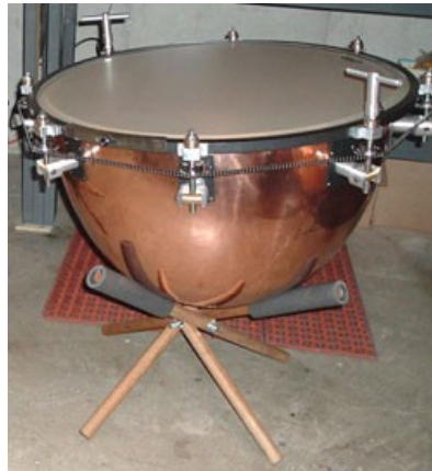
ภาพที่ 6.11 timpani