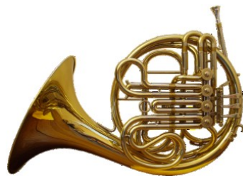
ภาพที่ 6.10 French horn

(4) เครื่องลมทองเหลือง (Brass Instruments) เป็นเครื่องเป่าอีกชนิดหนึ่งที่มีเสียงดังกังวานมีอำนาจได้แก่ฮอร์นหรือเฟรนฮอร์น (Hon French Horn) ทรัมเปท (Trumpet) ทรอมโบน (Trombone)