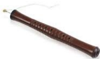
ภาพที่ 6.16 ปี่ใน