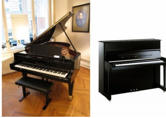
ภาพที่ 6.5 piano