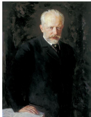
ภาพที่ 6.4 ปีเตอร์ ไชคอฟสกี (Petre Tchaikovsky)

ปีเตอร์ ไชคอฟสกี (Petre Tchaikovsky) คีตกวีชาวรัสเซีย ได้กล่าวไว้ว่า “ดนตรี คือ สิ่งที่ทำให้เราารู้ถึงความงามซึ่งเราไม่สามารถหาได้ในโลกไหน”