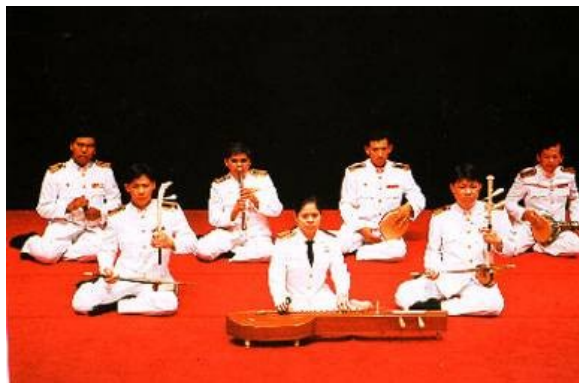
ภาพที่ 6.18 วงเครื่องสาย

2) วงเครื่องสาย เป็นวงที่ประกอบด้วยเครื่องดนตรีประเภทเครื่องสายเป็นหลัก มีเสียงดังไม่มาก ใช้ผู้บรรเลงจำนวนน้อย ใช้บรรเลงในงานมงคลทั่วไป เช่น งานวันเกิด งานขึ้นบ้านใหม่และที่นิยมบรรเลง คือ งานมงคลสมรส เครื่องดนตรีประกอบด้วย ซอด้วง ซออู้ จะเข้ ขลุ่ย โทน-รำมะนา และ ฉิ่ง ภายหลังมีการดัดแปลงให้แตกต่างออกไป เช่น นำเครื่องดนตรีต่างชาติมาผสม ซึ่งเรียกว่าเครื่องสายผสม หรือหากนำปี่ชวากับกลองแขกที่เป่าประกอบการชกมวยมาผสม ก็เรียกว่าวงเครื่องสายปี่ชวา