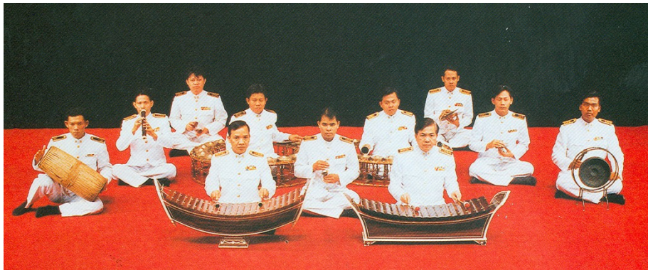
ภาพที่ 6.17 วงปี่พาทย์

(4) วงปี่พาทย์มอญ เดิมเป็นวงดนตรีของชาวมอญ ครั้งแรกนำมาใช้บรรเลงในงานศพ และใช้เป็นแบบอย่างจนถึงปัจจุบัน รูปแบบการบรรเลงได้พัฒนาเปลี่ยนแปลง จนเป็นเอกลักษณ์ของคนไทย บางโอกาสนำไปบรรเลงประกอบการแสดงลิเกเพื่อให้เข้ากับเนื้อเรื่องของการแสดง เครื่องดนตรีที่สำคัญประกอบด้วย ปี่มอญ ระนาดเอก ระนาดทุ้ม ซ้องมอญวงเล็กและใหญ่ ตะโพนมอญ เปิงมางคอก โหม่ง ฉิ่ง ฉาบ