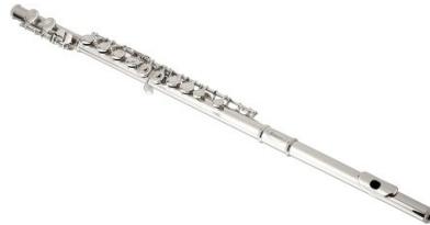
ภาพที่ 6.9 flute