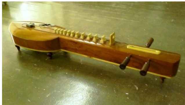
ภาพที่ 6.12 จะเข้