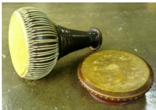
ภาพที่ 6.15 โตน รำมะนา