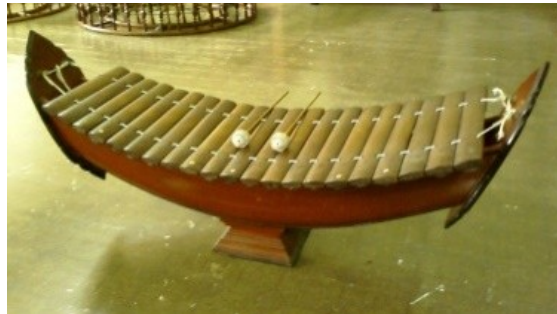
ภาพที่ 6.14 ระนาดเอก