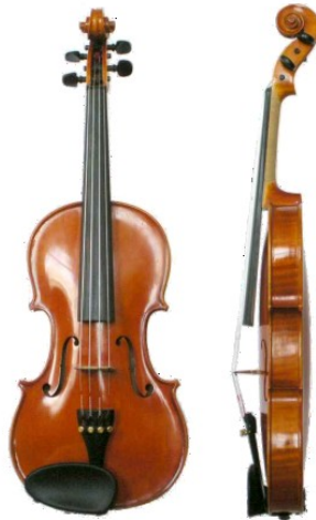
ภาพที่ 6.6 violin

(2) เครื่องสาย (String Instruments) คือเครื่องดนตรีที่เกิดเสียงโดยการดีดหรือสีที่สายขนาดต่างๆ อยู่ที่เครื่องดนตรีนั้นได้แก่ไวโอลิน (Violin) ฮาร์พ (Harp)