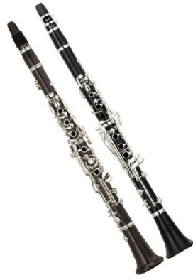
ภาพที่ 6.7 clarinet