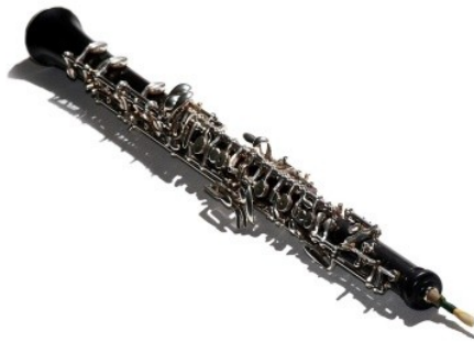
ภาพที่ 6.8 oboe