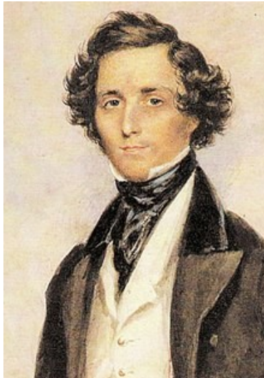
ภาพที่ 6.2 เฟลิกซ์ เมนเดลโซห์น (Felix Mendelssohn)

เฟลิกซ์ เมนเดลโซห์น (Felix Mendelssohn) คีตกวีชาวเยอรมัน ชื่อเยอรมัน ยาค็อบ ลุดวิก เฟลิกซ์ เมนเดลโซห์น-บาร์โธลดี (Jakob Ludwig Felix Mendelssohn-Bartholdy) ได้กล่าวไว้ว่า “ดนตรี คือ อาณาเขตที่คำพูดไม่สามารถตามถึงได้”