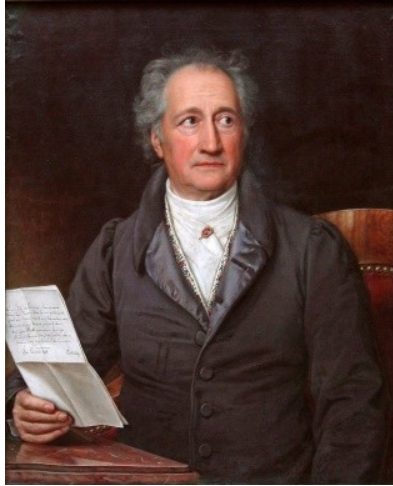
ภาพที่ 6.3 เกอเธ่ (Goethe)