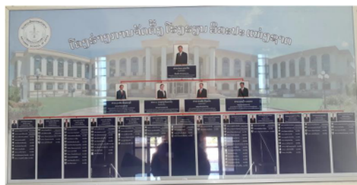
รูปภาพที่ 2 แผนผังนุคกลาง โรงเรียนศิลปะแห่งชาติ สปป.ลาว ที่มา: ทัศนีย์ เพ็ญสิทธิ์. 2 พฤศจิกายน 2561