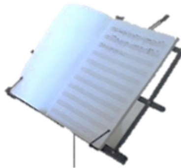
รูปภาพที่ 12-13 แบบฝึกหัดและบทเพลงสำหรับท롬โบน โรงเรียนศิลปะแห่งชาติ สปป.ลาว ที่มา: ทัศนีย์ เพ็ญสิทธิ. 2 พฤศจิกายน 2561

อย็ปรักตามนายเพ็ชรทะไซ อำพะวง เป็ครูผู้สอนท롬โบน แนะนำว่านักเรียนที่จะเข็มาเรียนที่โรงเรียนแห่งนี้นักเรียนจะด้องมีความพร้อมทั้งทักษะความรู้ความสามารถในขั้นพื้นฐานเป็อย็งดี ด้องมีอุปกรณ์เครื่องดนตรีเป็ของตัวเอง หรือถ็นักเรียนคนใดไม่สมัารถมีเครื่องเป็ของตัวเองได้จริงๆก็ด้องมีค่าใช้จ่ายไปเช่าเครื่องของโรงเรียนได้ โดยจะด้องหักยัดค่าเช่าไปรษายไป 700,000 กีบ โดยประมาณ หรือ คิดเป็เงินบาท คือประมาณ 3,000 บาท ทั้งนี้เพราะว่าโรงเรียนและรัฐบาลไม่มีเงินพอที่จะสนับสนุนในการซื้ออุปกรณ์เครื่องดนตรีให้เพียงกับความต้องการตามจำนวนนักเรียนได้ จึงได้ริเ็เบ็ยเงินขึ้นเพื่อเป็การส่งเสริมกิจกรรมการเรียนการสอนของโรงเรียน และทั้งยังเป็การฝึกให้นักเรียนมีระเบียบวินัย มีความรับผิดชอบ และรักในสิ่งที่ตนเองชอบทำ เพราะฉะนั้นเมื่อนักเรียนจำยัดเข็มาเรียนแล้วนักเรียนจะด้องดูแลรักษาเครื่องดนตรีนั้นเสมือนเป็เครื่องของตัวเองเข็กัน แต่ถ็มีข้อเสียที่ว่านักเรียนไม่สมัารถนำเครื่องดนตรีนั้นๆกลับไปฝากบ้านหรือทบทวนที่บ้นได้ ฝั่งโรงเรียนจึงสนับสนุนให้นักเรียนมีเครื่องดนตรีเป็ของตัวเอง