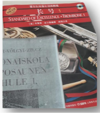
รูปภาพที่ 10-11 แบบฝึกหัดสำหรับการเรียนการสอนท롬โบน โรงเรียนศิลปะแห่งชาติ สปป.ลาว ที่มา: ทัศนีย์ เพ็ญสิทธิ. 2 พฤศจิกายน 2561

บทเพลง สำหรับการเรียนการสอนท롬โบนที่นี้ ไม่ได้มีความเป็ดนตรีคลาสสิกมากนัก บทเพลงที่เลือกก็จะเป็เพลงพื้นบ้านพื้นเมือง ที่เขียนหรือเรียบเรียงในท้องถิ่นมากเองร่วมกับเครื่องดนตรี หรือวงดนตรีอื่นๆ สำหรับในเพลงเดี่ยวเฉพาะของท롬โบนก็พอจะมีให้เห็นบ้างเช่น Czardas de monti เป็ต้น สำหรับใหญ่จะไม่ได้อยู็ในรูปแบบเพลงคลาสสิก หรือคอนเสิร์ตแบบด แต่ก็มีบ้างบางโอกาสที่ด้องบรรเลงเป็วงคอนเสิร์ตแบบดใหญ่ๆ หรืออย็วงซิมโฟนีออร์เคสตรา หรือวงวิנדแบนด เป็ต้น