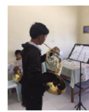
รูปภาพที่ 4-7 นมจากชมัยกิจกรรมการเรียนการสอนดนตรี โรงเรียนศิลปะแห่งชาติ สปป.ลาว ที่มา: ทัศนีย์ เพ็ญสิทธิ์, ปทุมพงษ์ ธรรมลังกา, 2 พฤศจิกายน 2561