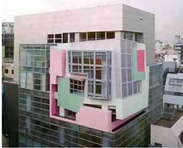
1990 Koizumi Sangyo Building Tokyo