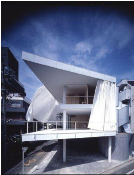
Shigeru Ban /