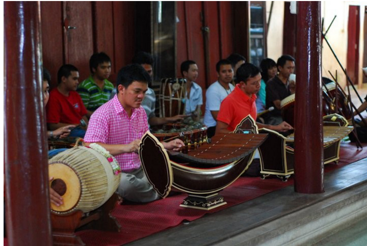
ภาพที่ 3 วงดนตรีที่บรรเลงประกอบพิธีทำขวัญนาค

พิธีการทำขวัญนาคเป็นพิธีปฏิบัติสืบต่อกันมานาน โดยการพรรณนาผ่านการขับร้องการแห่ประกอบบรรเลงดนตรีของวงปี่พาทย์ ซึ่งเพลงที่ครูชนะ ชำนิราชกิจ ใช้บรรเลงประกอบพิธีและบรรเลงประกอบการขับร้องสามารถแบ่งออกได้ 3 ประเภท ได้แก่