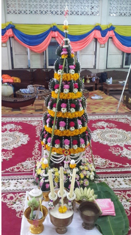
ภาพที่ 2 ต้นบายศรีและเครื่องประกอบพิธีทำขวัญนาค