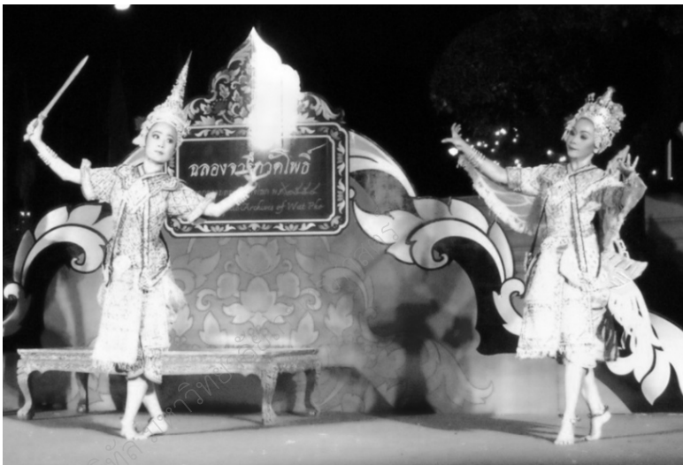
ภาพที่ ๒ ละครเรื่องพระลอนรลักษณ์ ตอนตามไม้ ของสถาบันบัณฑิตพัฒนศิลป์

พิจารณาจากบทจะเห็นกระบวนการแสดงในตอนนี้เป็นารำคู่ ไม่มีสองพี่เลี้ยงอยู่ด้วย เช่นเดียวกับพระรามตามกวางในเรื่องรามเกียรติ์