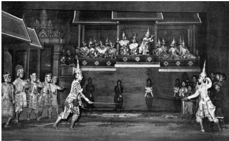
ภาพที่ ๔ ละครเรื่องสังข์ทอง ตอนตีคัลลี

ที่มา: The Khon and Lakon by Dhanit Yupho