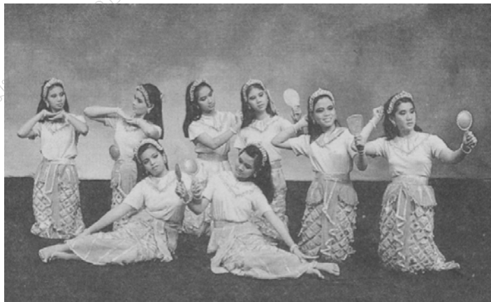
ภาพที่ ๘ ระบำเงือกในละครนอกเรื่องพระอภัยมณี ที่มา: บทละครนอกเรื่องพระอภัยมณี ตอนกำเนิดสุดสาครถึงเขื่อนเมืองการเวก