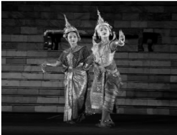
ภาพที่ ๓ ฉะครเรื่องพระสมุท ตอนพระสมุทพานางบุษมาลีขึ้น

บทละครนอก ๔ เรื่องดังกล่าวมีลักษณะเช่นเดียวกับบทพระราชานิพนธ์ละครนอกรัชกาลที่ ๒ ดังนี้