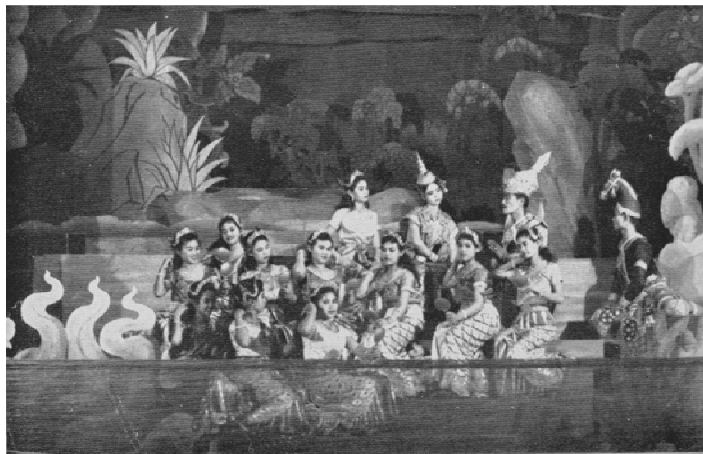
ภาพที่ ๗ ละครนอกเรื่องสุวรรณหงส์ นางเกศสุริยกับบรรดาเงือกน้ำ