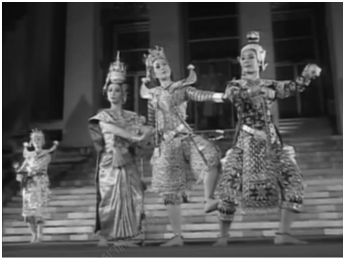
ภาพที่ ๑ ละครเรื่องดาหลัง ตอนปั้นหยีชิงนางบุษบาสำหรับ จิตาทำวปันจะร่ากัน

จากบทละครเรื่องสังข์ทองแสดงว่าในสมัยพระบาทสมเด็จพระพุทธเลิศหล้านภาลัย ยังรับรู้เรื่องราวของดาหลังเล่นเป็นละครหลวงเช่นเดียวกับเรื่องอิเหนา ซึ่งเป็นการสืบเนื่องมาจากสมัยอยุธยา ดาหลังบทพระราชนิพนธ์รัชกาลที่ ๑ มีกระบวนแบบละครใน บทเดิมของเจ้าฟ้ากุณฑลสหมัยอยุธยาก็น่าจะมีลักษณะเดียวกันเพราะเจ้าฟ้าพระราชนิพนธ์ ๒ พระองค์ของสมเด็จพระเจ้าบรมโกศทรงนิพนธ์เรื่องไว้คู่กัน และสืบทอดมาเป็นอิเหนาและดาหลังในสมัยรัตนโกสินทร์ ไม่ปรากฏหลักฐานว่ามีการแต่งเรื่องดาหลังขึ้นใหม่ในสมัยต่อมา ดังนั้นถ้าละครข้างนอกนำเรื่องดาหลังไปเล่นก็น่าจะใช้บทเดิมแต่ปรับกระบวนอย่างที่เหมาะสม เจ้าฟ้ากรมพระยานริศรานุวัดติวงศ์ทรงอธิบายไว้