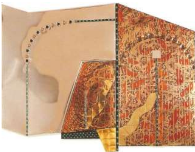
ชื่อผลงาน :: ชีวิต ๒๕๓๗ ของ เดชา วราชน ศิลปินแห่งชาติ (ทัศนศิลป์)