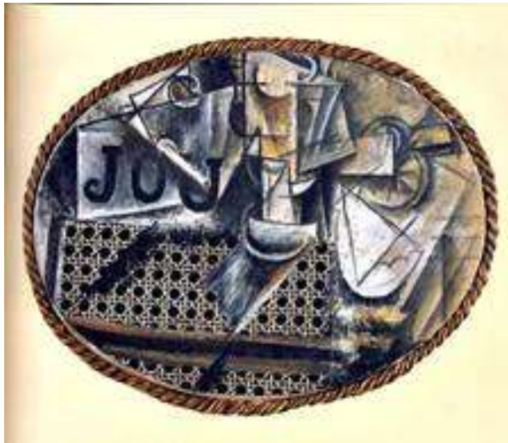
STILL LIFE WITH CHAIR CANNING, 1912

ศิลปะสื่อผสมเริ่มในปี ค.ศ.1912 (พ.ศ.2455) โดยปิกัสโซ และบราค ด้วยการนำวัสดุต่างๆ เช่น กระดาษปิดฝาผนัง กระดาษและภาพจากหนังสือนิตยสาร ผ้า แผ่นไม้ ฯลฯ มาสร้างสรรค์ผลงานด้วยกลวิธีการของศิลปะแบบภาพปะติด (COLLAGE) ผสมผสานกับการวาดในภาพ เพื่อให้เกิดมิติทางอารมณ์สัมผัส และยังเป็นการแสวงหากลวิธีในการแสดงออกทางความงามในรูปแบบใหม่ๆ ผลงานที่มีชื่อเสียงตามกลวิธีนี้ เช่น STILL LIFE WITH CHAIR CANNING นอกจากนี้ยังได้พัฒนาการสร้างผลงานโดยใช้วัสดุสำเร็จรูปที่มีลักษณะ 3 มิติ ปะติดลงในผลงาน เช่น GUITAR AND BASS BOTTLE เป็นต้น ต่อมาศิลปะแบบ ภาพปะติด ได้ถูกนำมาดัดแปลงใช้ในองค์ประกอบที่หลากหลาย จนประยุกต์สู่ยุคปัจจุบันที่รู้จักกันในนาม สื่อผสม (MIXED MEDIA) ซึ่งหมายถึงการนำเอาวัสดุ และกลวิธีต่างๆ ในการสร้างงานทัศนศิลป์มา ผสมผสานกันด้วยการจัดองค์ประกอบทางศิลปะให้เกิดเป็นรูปแบบความงามใหม่อย่างอิสระ