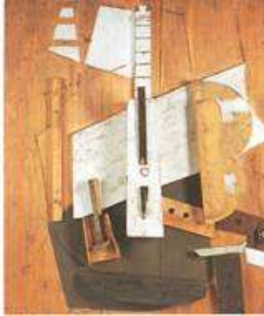
GUITAR AND BASS