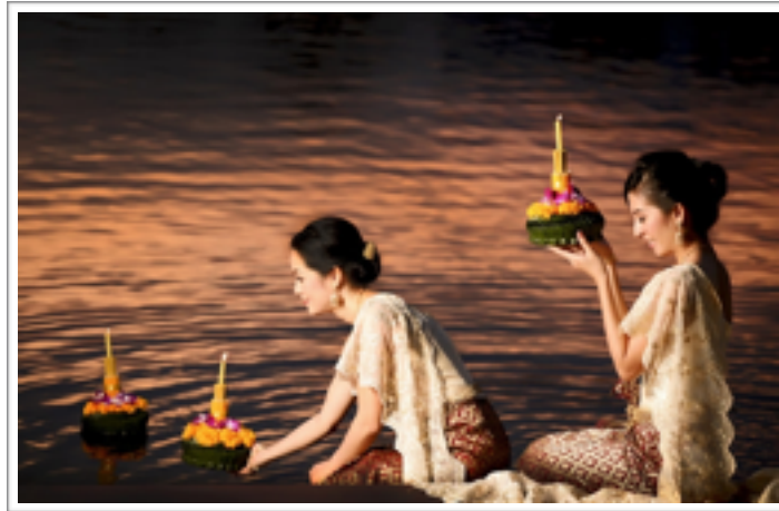
ภาพที่ 2: Loy Krathong Day