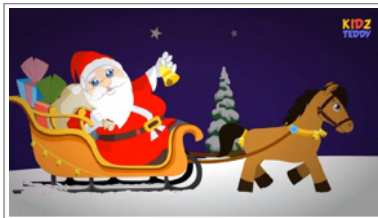
ภาพที่ 1: Christmas Day