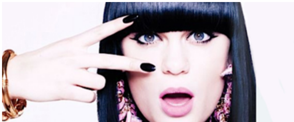
ภาพที่ 7: Jessie J นักร้องชาวอังกฤษ